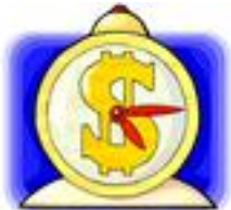
TABELLA COMPARATIVA COSTI